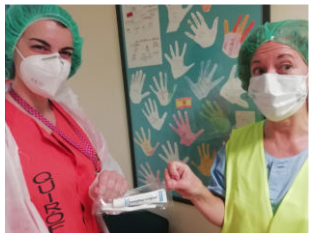
Sanitarios del Hospital Gregorio Marañón.