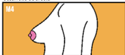
Areola elevada por encima del contorno de la mama