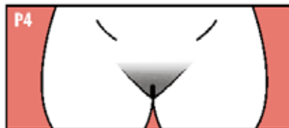
Vello rizado como en los adultos, sin incluir aún los muslos