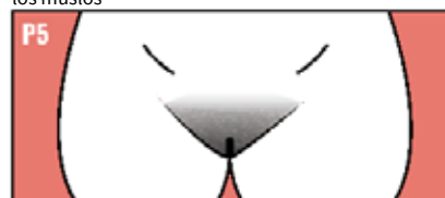
Vello adulto en cantidad y calidad, extendido hasta los muslos

Nota: Al comienzo de la pubertad, las niñas que llegan al estadio 2 de Tanner (o “telarquia”, es decir, el inicio del desarrollo mamario secundario) o al estadio 3 de Tanner (es decir, cuando el desarrollo mamario es mayor) pueden correr el riesgo de tener un embarazo no deseado como consecuencia de una agresión sexual o violación porque es probable que estén ovulando incluso antes del inicio de la menstruación.