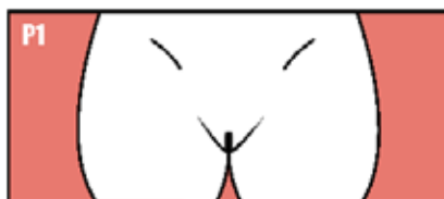
Prepuberal, sin vello púbico