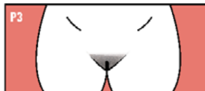
Vello rizado más oscuro y grueso