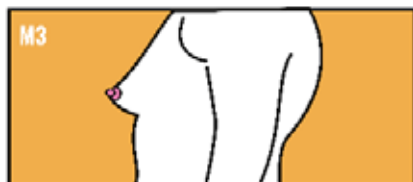
Tejido mamario palpable fuera de la areola, sin desarrollo de areola