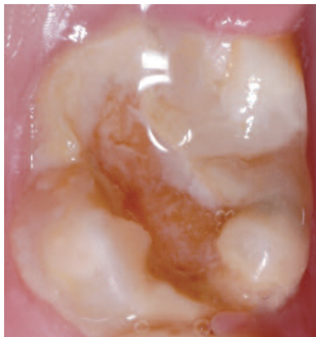
Figura 2. Lesión de gran tamaño y rápida evolución en un molar con MIH.

Clínicamente, el MIH cursa con opacidades marcadas y defectos de esmalte con alteración de la translucidez; el esmalte afectado es de color blanco-cremoso o amarillo-marrón, con un espesor normal, una superficie suave y un límite claro que lo diferencia del esmalte normal adyacente 3 . El esmalte hipomineralizado puede desprenderse rápidamente, dejando a la dentina desprotegida 9 (Figura 2), por lo que este tipo de molares suelen presentar caries de rápida evolución y en lugares poco comunes de aparición, gran sensibilidad ante estímu-