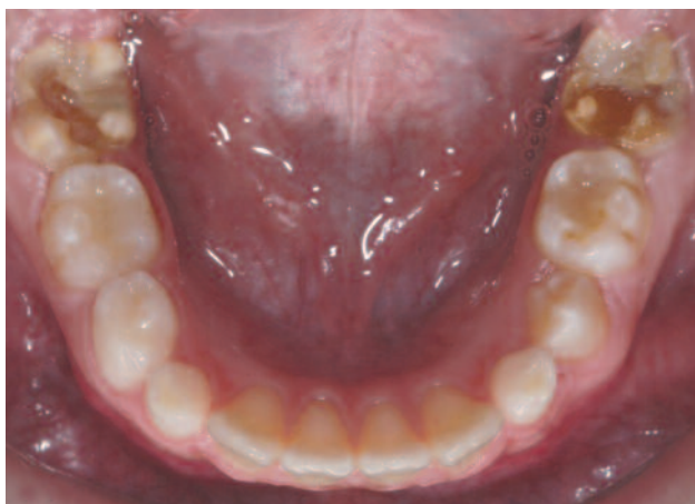
Figura 1. Gran afectación de molares como consecuencia del MIH, estando los incisivos sanos.

El término "síndrome incisivo molar" (MIH) fue introducido en el año 2001 por Weerheijm y cols., y se definió como una hipomineralización de origen sistémico que afecta de 1 a 4 de los primeros molares permanentes y que se asocia frecuentemente con alteraciones en los incisivos (Figura 1) 1 . No se ha encontrado un único factor causal para este desorden, y cabe destacar la amplia variación en la prevalencia de la enfermedad que se puede observar en los diferentes grupos de población (2,4 - 40,2%) 2 . Los problemas clínicos más comunes para los pacientes con MIH son la ruptura posteruptiva del esmalte, la exposición dentinaria, la formación de cavidades atípicas, la completa distorsión de la corona y una molestia severa con los estímulos fríos 3 . Los molares hipomineralizados tienen un contenido mineral un 5% menor y una proporción calcio/fosfato menor que el esmalte sano 3 .