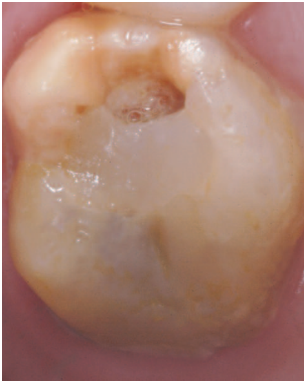
Figura 4. Gran reconstrucción fracturada, con afectación cuspídea, en un molar con MIH.

El manejo restaurador generalmente va a depender de la severidad del defecto, la cooperación y edad del niño. Las opciones terapéuticas van desde tratamientos preventivos, como instrucciones dietéticas y de higiene oral, aplicación tópica de flúor y colocación de selladores de fosas y fisuras, a grandes reconstrucciones con resina compuesta (Figura 4), la colocación de coronas preformadas o de restauraciones indirectas, o incluso la extracción del molar afectado en casos muy severos 14 .