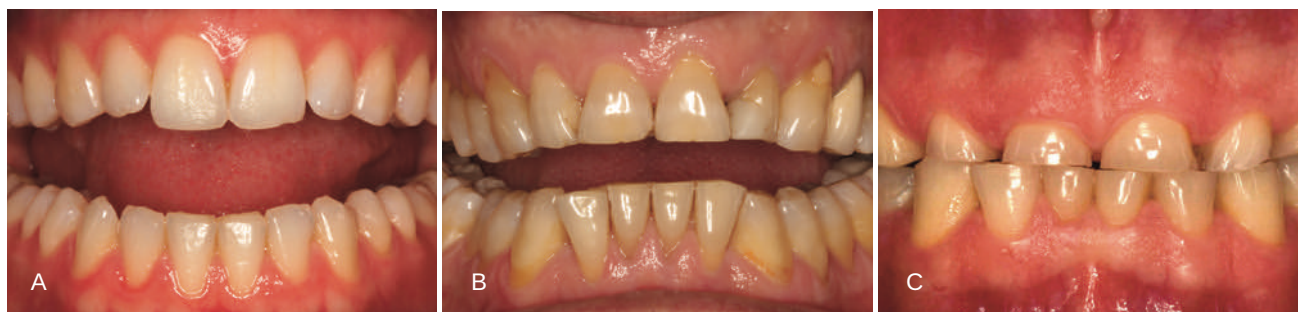
Figura 2. A) Desgaste dental leve, B) Desgaste dental moderado C) Desgaste dental severo.

fracción (84,8% de los pacientes), seguida de erosión y atrición (3% y 12,2% de los pacientes respectivamente).